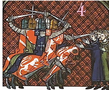
Iluminuras medievais nas crônicas que relatam a cruzada albigense: 1. Inocêncio III e seus legados; 2. Enviados do papa junto ao rei Luís VIII de França; 3. O papa excomungando os hereges; 4. Cruzados massacraram os cátaros.